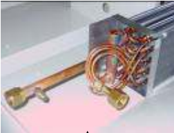
Pos. 2 , 3